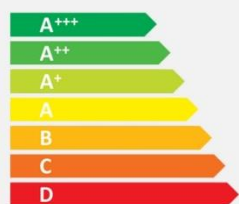
Old energy label